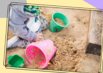
En el jardín, ¿te han enseñado a leer o a escribir?